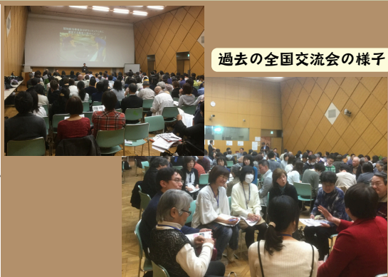
過去の全国交流会の様子

〔JR〕 中央線・総武線 御茶ノ水駅から徒歩8分 〔地下鉄〕 東京メトロ丸ノ内線 御茶ノ水駅から徒歩7分 東京メトロ千代田線 新御茶ノ水駅から徒歩11分 東京メトロ丸ノ内線・都営大江戸線 本郷三丁目駅から徒歩13分 ※駐車場はございません。公共交通機関を利用してお越しください。