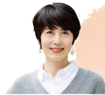
登壇ゲスト 小島慶子氏 エッセイスト メディアパーソナリティ

終了後はゲスト・小島慶子さんによるサイン会を開催します！ 当日ご参加いただいた方の中から抽選で5名様限定となります。 ファンの皆様にとって貴重な機会となりますので、ぜひご参加ください。