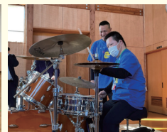
みしゃモンカレッジ