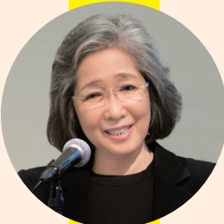
金澤泰子氏 書家・随筆家