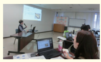
横浜市社協 当事者講師養成講座 模擬演習