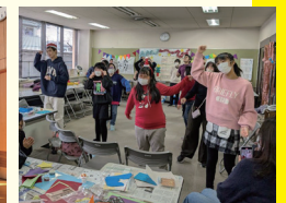
春日井子どもサポート KIDS COLOR